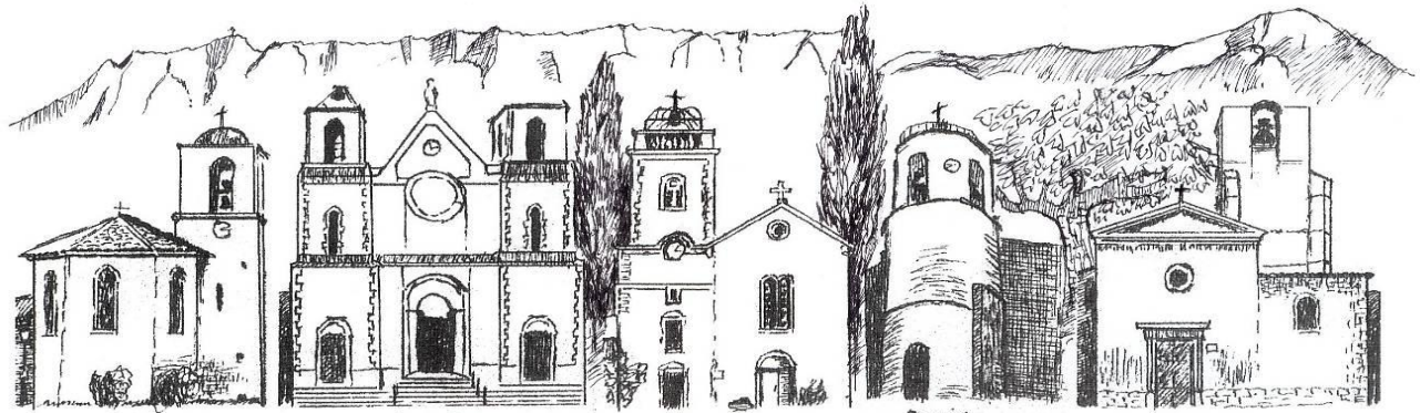
Châteauneuf-le-Rouge Saint Antoine l'Ermité