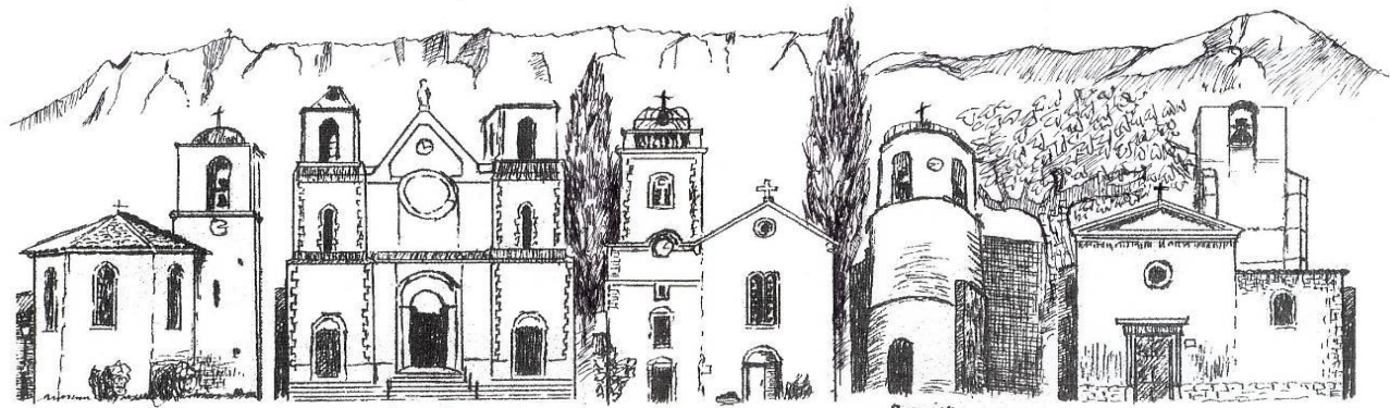
Châteauneuf-le-Rouge Saint Antoine l'Ermite